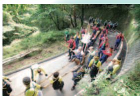
集う氏子で山道いぼり