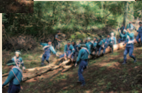
おみごと。大勢乗せて大成功!

10月8・9・10日の3連休は、里曳きラッシュに沸き、市内全域が小宮祭一色に染まった。山出し以来、これでもかの長雨に気をもんだものの、終わりよければすべてよし。地域の仲間と楽しくやりきって、めでたしめでたし。みなさま、お疲れさまでした。