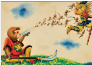
そんごくう 1957年 武井武雄