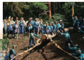
迫力を間近で体感