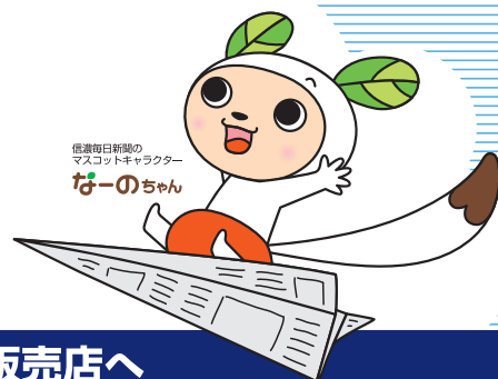
信濃毎日新聞のマスコットキャラクター「な-のちゃん」

購読のお申し込みは フリーダイヤル 0120-81-4341 又は 最寄りの信毎販売店へ