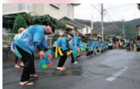
御社宮司社前での太鼓奉納&花笠踊り