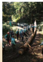
柱の向きを整えて、坂下より曳行