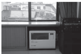
【間下区】暖房機など

宝くじの社会貢献広報事業である「地域活動助成事業」を活用し、公益財団法人長野県市町村振興協会より宝くじの助成を受けて、間下区で暖房機などを、岡谷区で会議イスなどを整備しました。