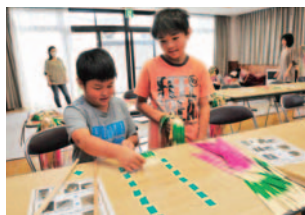
製作中。 うまくできるかな？