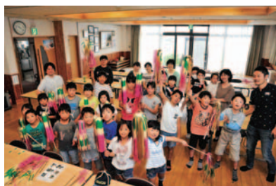
小宮祭、みんなでがんばるぞ〜