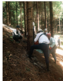
細心の注意を払い 大胆に切る…

自分のおんべを完成させると、この日出席できなかった仲間のおんべを作る児童も…。木遣りは、夏休み中、ラジオ体操の後に連日特訓。みんな、じょうずにできたとおんべで、絶好調の木遣りをよろしく。