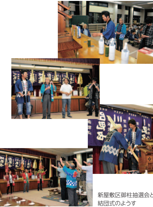
新屋敷区御柱抽選会と結団式の様子