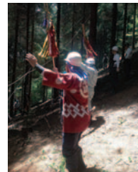
木遣りが森に響く