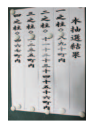
三沢区の抽選結果