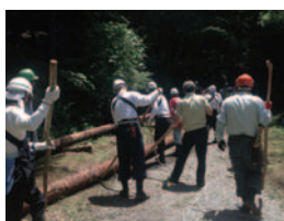
テコでの整列 お手のもの