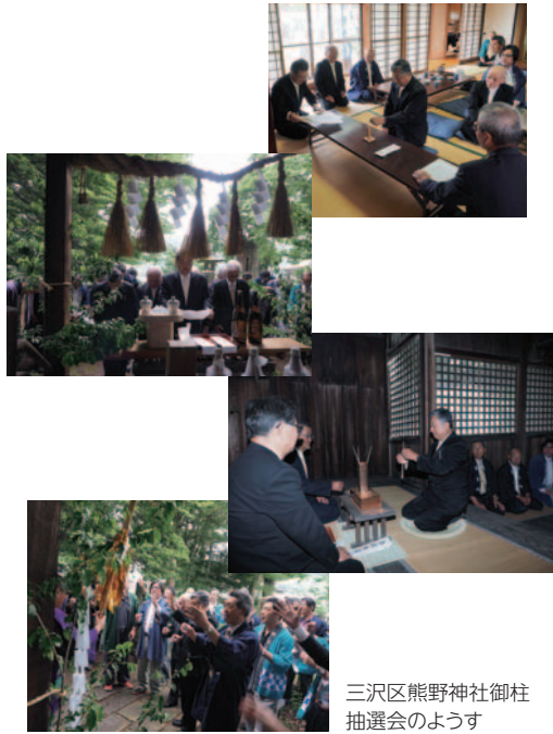
三沢区熊野神社御柱抽選会の様子