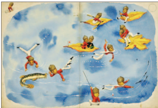
タイトル・制作年不詳 武井武雄