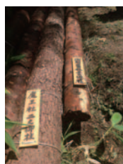
二の柱が仲良く寄り添う