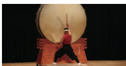
世界和太鼓打ち比ベコンテスト