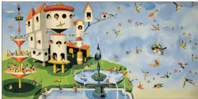
「ことりのくに」1956年 武井武雄