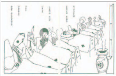
『おもちゃ箱』より 武井武雄