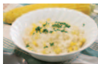
野菜万菜～とうもろこし～