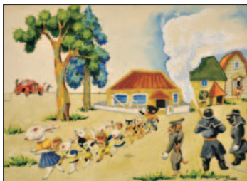
ひなんくんれん 『チャイルドブック』より 武井武雄

3月31日に発生した「川岸地区山林火災」は、面積約45haを焼損する、岡谷市政始まって以来の大きな山林火災となりました。 冬から春にかけては、空気が乾燥すること、またお彼岸のお墓参りがあり、畑仕事も始まって、毎年、墓地や畑の土手などを焼く火災や、これが山林に燃え移る火災が発生しています。 今回の火災では、改めて山林火災の恐ろしさを痛感しました。風により発生箇所から複数箇所へ飛び火し、広がっていく火。消えたと思っても落ち葉の下等ですぐり続ける火。消防水が充分でなく、また、急峻で距離もあり現地にたどり着くにも困難な山。山全体が乾燥し燃えやすくなっていること。などなど、山林特有の状況があり、対応・対処に大変苦慮しました。 人的被害がなかったことが不幸中の幸いではありましたが、山林・農地の所有者の皆様にとっては、大きな損害を被られたことと思います。被災されました皆様に心からお見舞いを申し上げます。 市民の皆様には、より一層、火の取り扱いには注意していただきますようお願いいたします。 改めまして、消火活動や情報・物資の提供などにご支援、ご協力いただきました、全ての皆様に厚くお礼申し上げます。 市民の皆様にも、大変ご心配をおかけ致しましたが、これまでのご協力に感謝申し上げます。