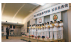
いとしの我が母校 校歌の旅