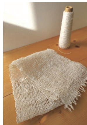
自分で織った世界で一枚のシルクのタオルです

ボディタオルなので、ざっりとした織り目ではなく、やさしくやさしく織っていくと柔らかなタオルに仕上がりました。トルネードシルクの糸には、シルク特有のセリシンと呼ばれる成分が含まれているため、これでお肌を洗うとすべすべになると言われています。さっそくシルク石けんと合わせて使ってみて、その効果を試してみようと思います。