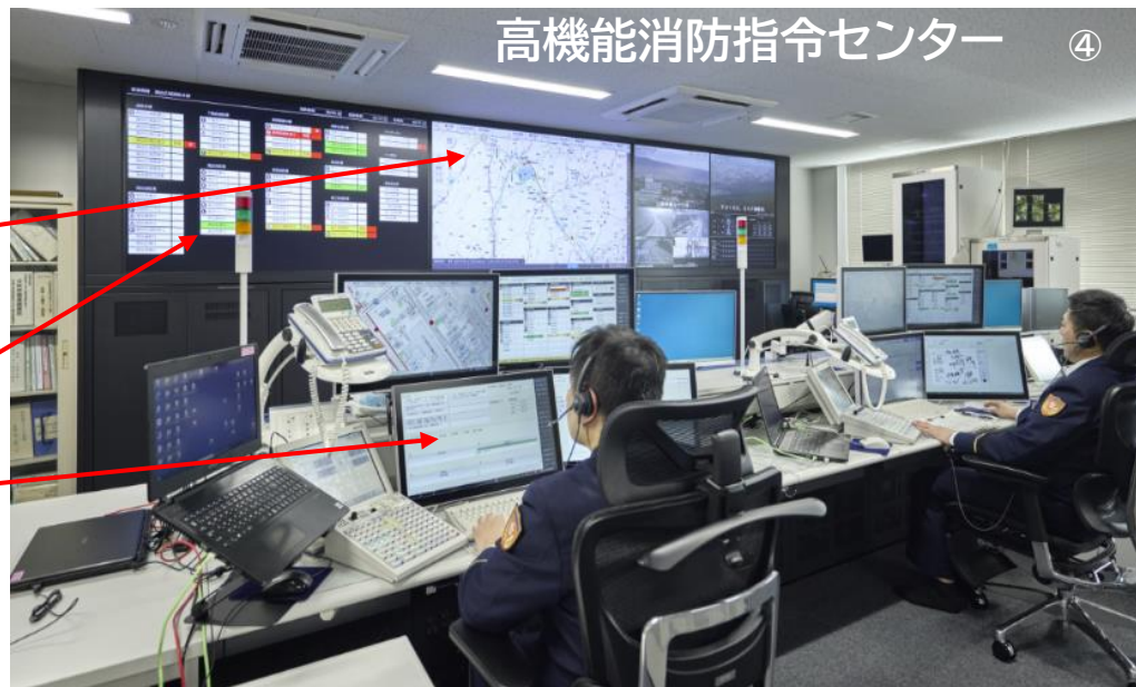
高機能消防指令センター