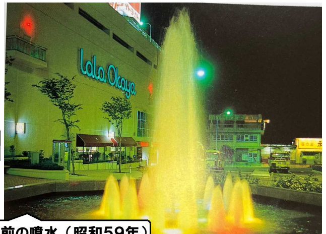
駅前の噴水（昭和59年）