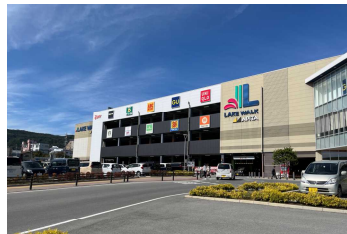
レイクウォーク岡谷テナント店会