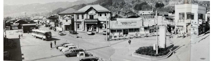
出典：「新しい岡谷の創造に向けて」1984（昭和59）年 岡谷市発行 p. 40

広報誌などから旧市史<岡谷市史下巻1982(昭和57)年刊行. 編年：昭和20年～昭和53年>以降の岡谷市のできごとを中心に、テーマを設けてシリーズとして拾っています。令和6年最初の今回は商業関係です。