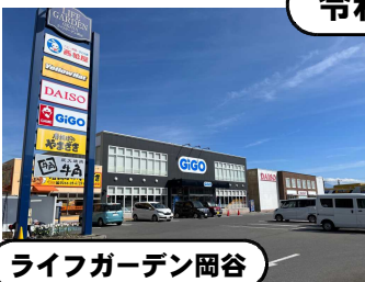
ライフガーデン岡谷