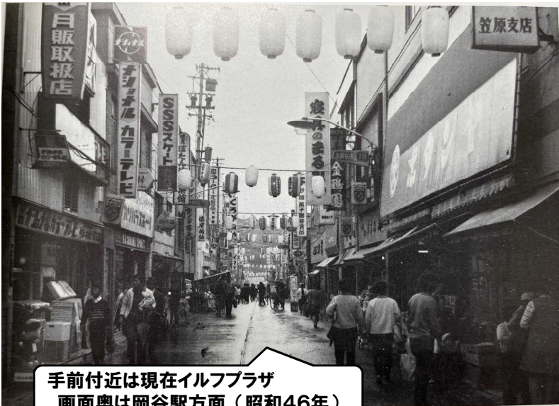
手前付近は現在イルプラザ 画面奥は岡谷駅方面（昭和46年）