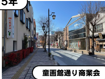
童画館通り商業会