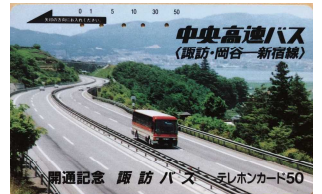
↑ 高速バス開通記念のテレカ

広報誌などから旧市史(岡谷市史下巻 1982(昭和57)年刊行 編年:昭和20年～昭和53年)以降の岡谷市のできごとを中心に、テーマを設けてシリーズとして拾っていきます。今回は交通関係です。