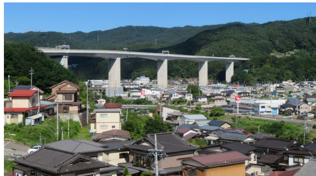
1986(昭和61)年 撮影 出典：「岡谷の今昔」昭和61年 岡谷市教育委員会編