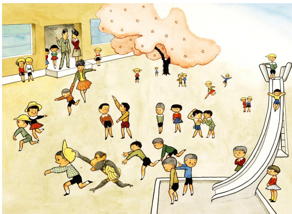
武井武雄「おさるのぼっくん」1963年 ©岡谷市/イルフ童画館