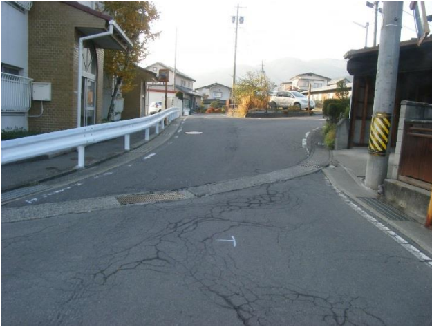
対策：外側線、T字マーク引き直し