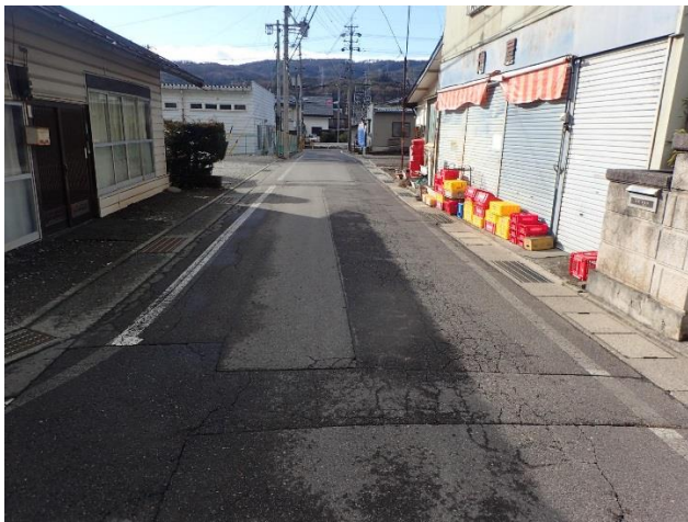
対策：グリーンベルト、外側線等