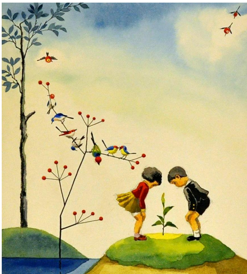
武井武雄「2年」1958年 ©岡谷市/イルフ童画館