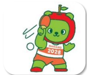
長野県PRキャラクター「アルクマ」

令和10(2028)年に開催される第82回国民スポーツ大会・第27回全国障害者スポーツ大会に向け、機運醸成を図りながら、万全な開催準備を推進します。また、これを契機に、スポーツに対する市民の関心を高めるとともに、大会終了後も大会開催の成果を本市の財産として、未来へ継承します。