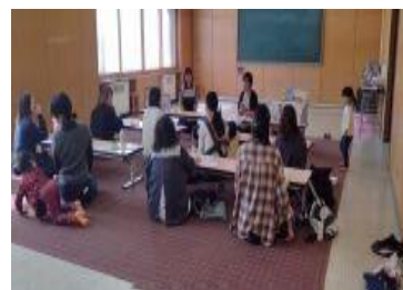
(子育てサークルの訪問)

地域の子育てサークルや育成会などに図書館訪問を年間行事に盛り込むよう呼びかけます。