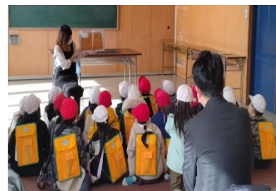
(小学生の図書館訪問)

小中学校において朝読書のさらなる充実を図り、生活リズムの中へ読書習慣の定着を図ります。そのために「読書」の選択肢のひとつとして、タブレット端末による電子図書の体験導入を検討し、情報教育との相乗効果を生み出します。