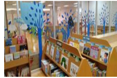
(子育て支援館こどものくに)

ブックリストのおすすめ絵本コーナーに加え、保護者がホッとできる図書コーナーを充実します。また、毎日午前午後に体操や読み聞かせを行い、子どもと保護者に絵本の楽しさを紹介します。さらに、出版社が新刊本を紹介し毎月発行する「こどもの本」を配置し、図書館に新たに収蔵した子ども向け図書の紹介を定期的に行います。