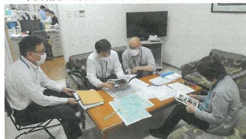
スタッフ打ち合わせ会議の様子