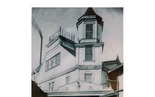
M 岡谷座 御倉町に明治43年創立。岡谷地方の劇場としては最も早い。宝座、三沢座などとともに製糸従業員娯楽施設として人気を博した。