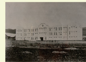
J 諏訪蚕糸学校(現岡谷工業高等学校) 岡谷の中等教育は明治45年の平野農蚕学校から始まった。後に蚕糸業の発展と衰退を背景に学校名と履修学科を変化させ、現在も岡谷の産業・教育を支えている。