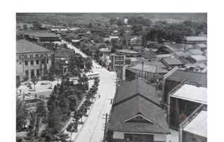
N 中央通り・今井新道