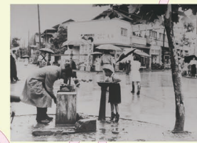
H 中央通りのまんなか。イルフプラザの北口に立つと、当時の風景と比べることができる。