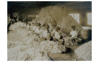
L 山共岡谷製糸の選繭場 良質な原料繭を確保することが、製糸業にとっては重要であった。製糸家たちは明治期から県外へ原料繭を求めて進出していった。写真は工女一人一人の手によって繭を選び分けている様子。