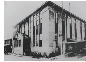
B かつての郵便局。その後建物が利用された旧市立図書館といえば、市民に懐かしい。