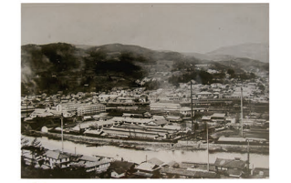
K 天竜川から岡谷駅南側にかけての工場群。