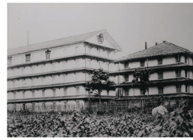
E 吉田館の繭倉庫は高層の5階建て。製糸の発展を物語る風景や匂いは、人々の記憶のなかに残る。