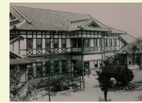
I 平野製糸共同病院(現市立岡谷病院) 明治42年に製糸業者が共同出資して従業員やその家族の診療を主とする病院を作った。こうした例は全国的にも早かった。