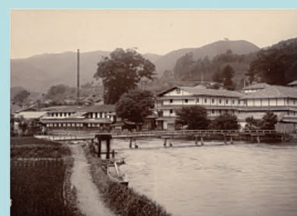
天竜河畔の製糸工場