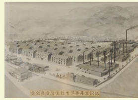
F 諏訪倉庫資料より往時の塚間倉庫群。