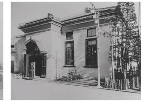
岡谷には銀行の支店が軒を並べていた。 C 安田銀行(左) D 八十二銀行(右)、どちらも立派な構え。