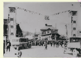
G 市制施行に沸く駅前広場。昭和11年。