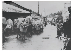
A 小口薬師堂から東に伸びる通りは工女でにぎわう繁華街だった。写真はだるま祭り。