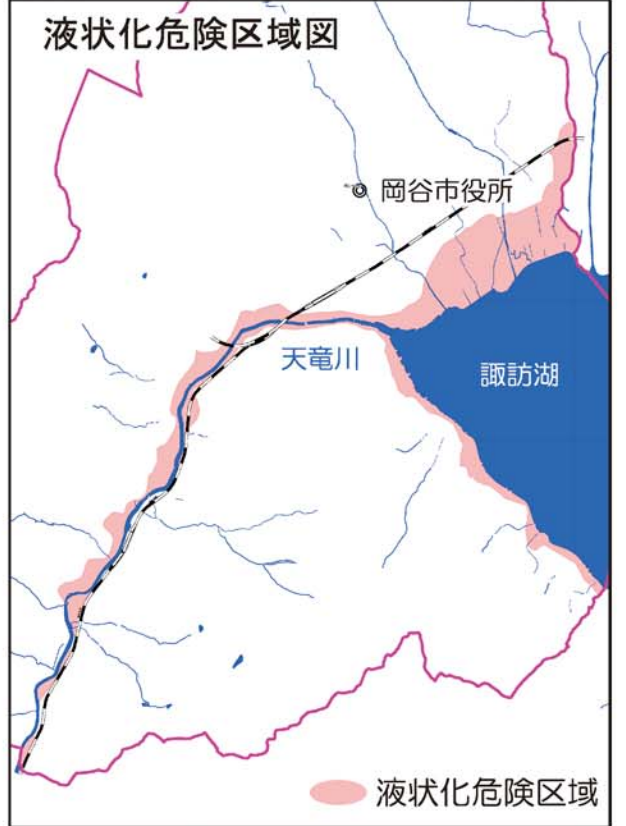
※岡谷市では、諏訪湖岸や天竜川沿いで液状化の可能性がります。