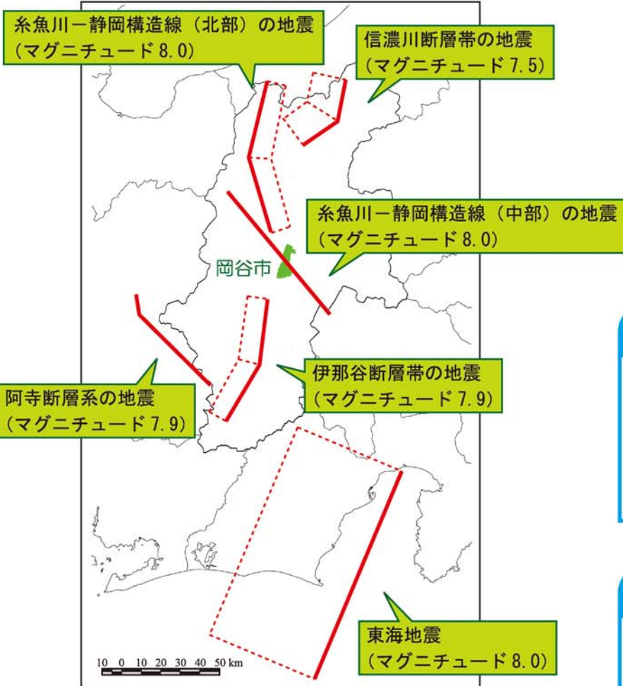
長野県が想定する6つの地震 『長野県地震対策基礎調査』(平成14年3月)より

地震防災マップは、今後発生する可能性のある地震について、市民の皆さんが関心と知識を持ち、日頃から地震に備える手助けとなるよう考えて作成されています。