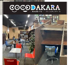
COCODAKARA (岡谷市長地権現町4-3-37)