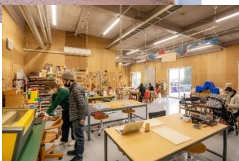
fabスペースhana_re (岡谷市山下町2-1-32)