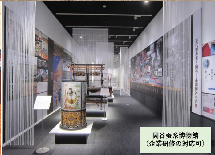
岡谷蚕糸博物館 (企業研修の対応可)