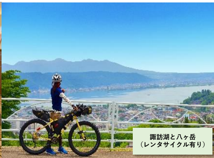
諏訪湖とハケ岳 (レンタサイクル有り)