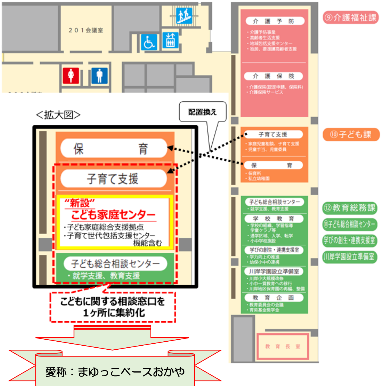
【市役所庁舎2階配置図】

また、こども家庭センター内に、旧子育て世代包括支援センター機能を担当する健康推進課職員用の席を設け、こどもに関する相談窓口を市役所庁舎2階の1ヶ所に集約し、相談支援体制のワンストップ化を図ります。