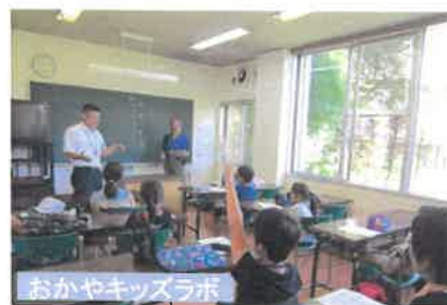
おかやキッズラボ