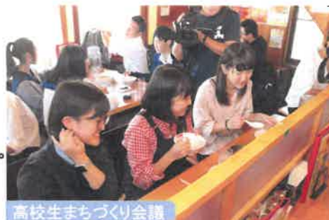
高校生まちづくり会議

【事業内容】 中高生へのキャリア教育を支援するため、進路選択や将来の地元就職に向けた講演会等を開催する。