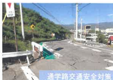
通学路交通安全対策