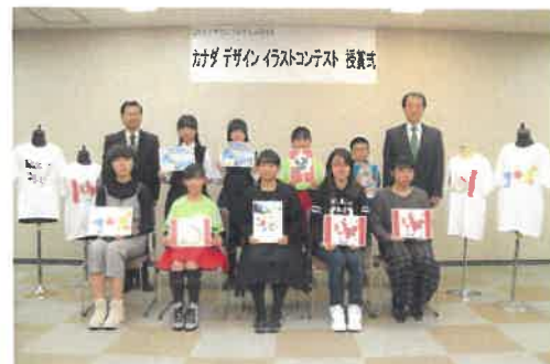
カナダデザインイラストコンテスト授賞式