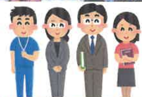
教員働き方改革推進事業