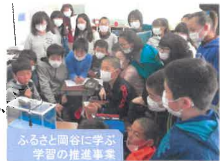
ふるさと岡谷に学ぶ 学習の推進事業

【事業内容】 主任指導主事を配置し、学力向上アドバイザーと連携しながら、各校の学力向上に向けた取組に対する助言・指導等を行う。