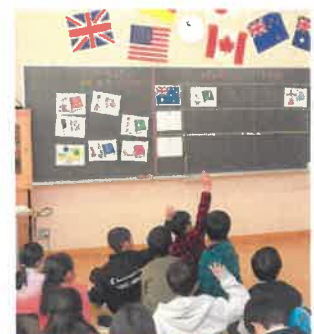
外国語指導主事による授業