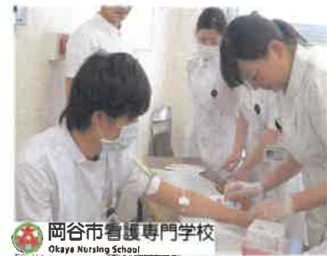
岡谷市看護専門学校 Okaya Nursing School