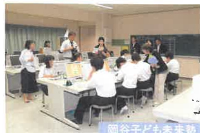
岡谷子ども未来塾

【拡充内容】 中学2年生を対象として放課後の学習支援を行うほか、新たに小学5年生を対象として加え、苦手科目の解消と学習意欲の向上を図るための講座を開催する。