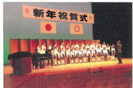
▲岡谷市文化会館大ホール舞台