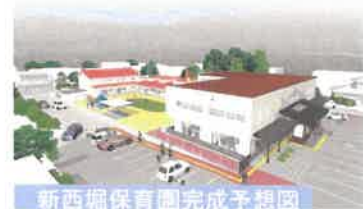
新西堀保育園完成予想図

【事業内容】 発達支援施設を併設する新西堀保育園の令和2年12月開園に向け建設工事を行う。