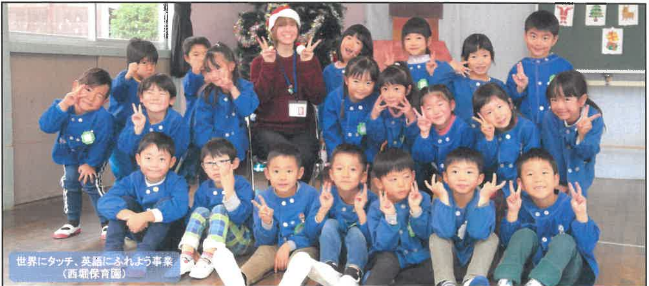
世界にタッチ、英語にふれよう事業 (西郷保育園)