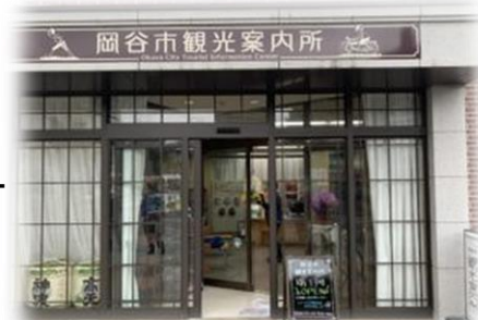
岡谷市観光案内所