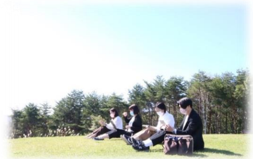
鳥居平やまびこ公園にて、ワーケーション

※ワーケーションとは、普段の働いているオフィスと離れた場所で、 休暇を楽しみながら働くスタイル