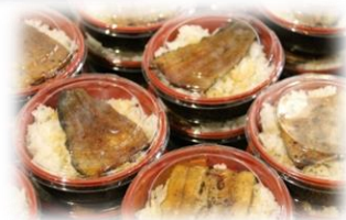
お昼は、岡谷のうなぎ