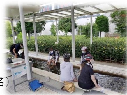
諏訪湖ハイツの足湯体験

2020年度岡谷フオトコンテスト入選スポット、鎌倉街道、足湯などを巡るサイクリングツアーを実施。