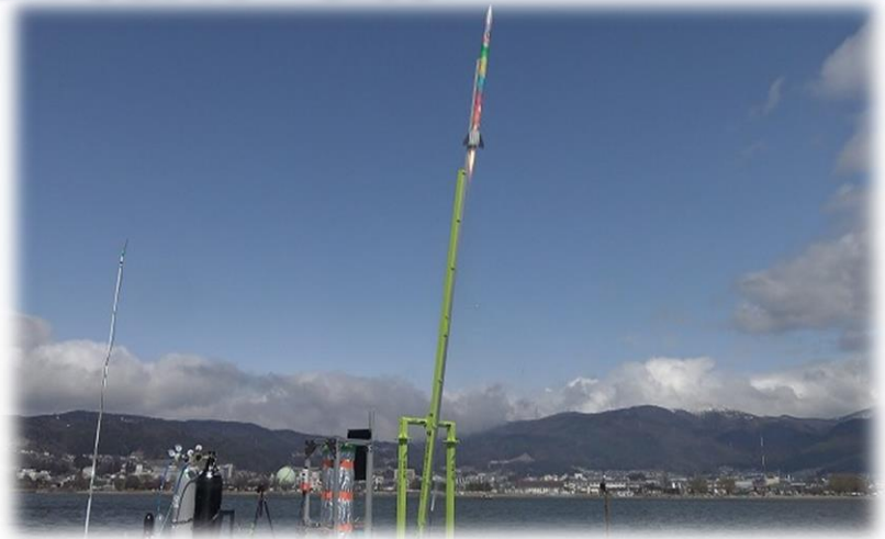
令和4年3月20日 諏訪湖から小型ロケットの打ち上げ成功

(1) 5市町村の製造業からの技術者が小型ロケット製作を通じ、ものづくりの各種高度技術を修得。 信大生などのプロジェクトへの参加により、諏訪圏企業の技術力の高さや魅力を体験し、諏訪圏への就職を検討できる機会を提供。