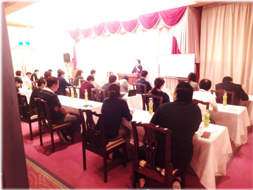
平成30年9月23日 コミュニケーションスキルUPセミナー & ランチパーティー 参加者数 男性14名 女性14名