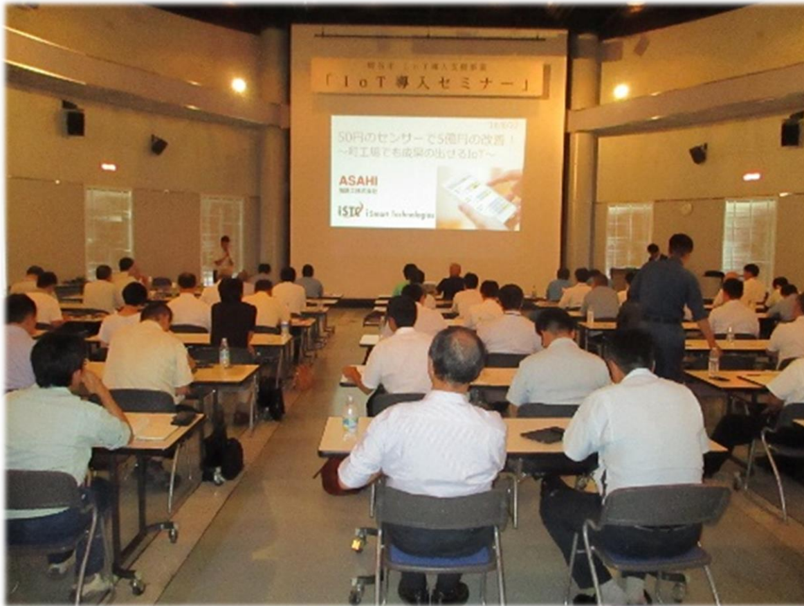
8月27日 「IoT導入セミナー」の実施（テクノプラザおかや）