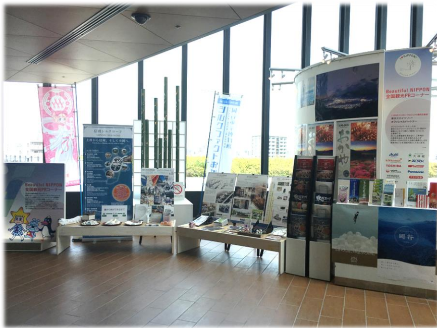
東京スカイツリー 5 階の 全国観光PRコーナー 「Beautiful NIPPON」で市の観光をPR