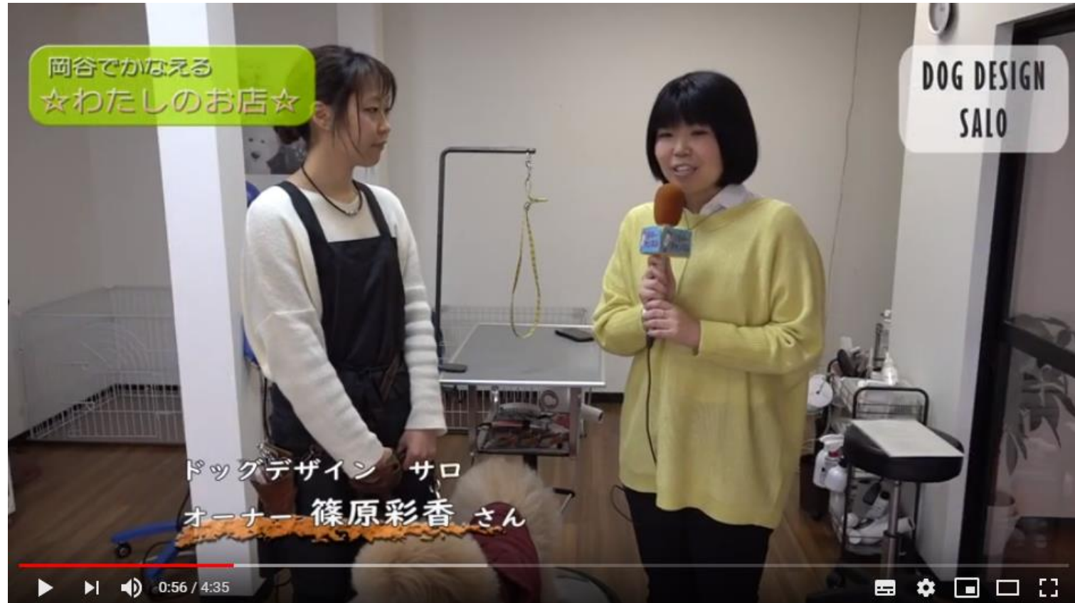
「DOG DESIGN SALO」