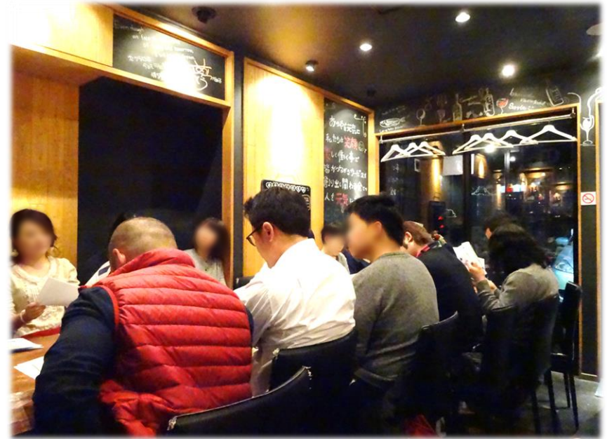
平成30年12月1日 ワイン講座&大人の恋活コン 参加者数 男性8名 女性7名