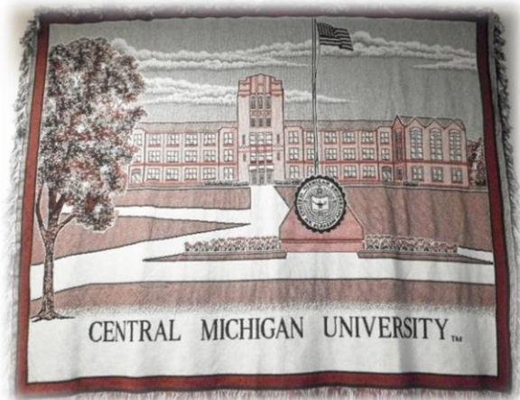
タペストリー（2種類）