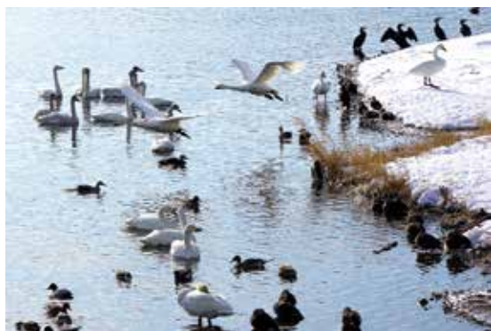
▲北帰行を待つ白鳥

【1人分の栄養価】 エネルギー：116kcal / たんぱく質：2.7g / 脂質：2.4g / 食塩：0.1g