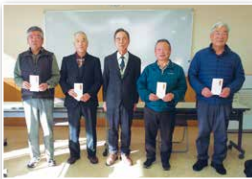
▲入選された皆さん