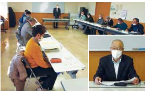
▲理事研修会の様子