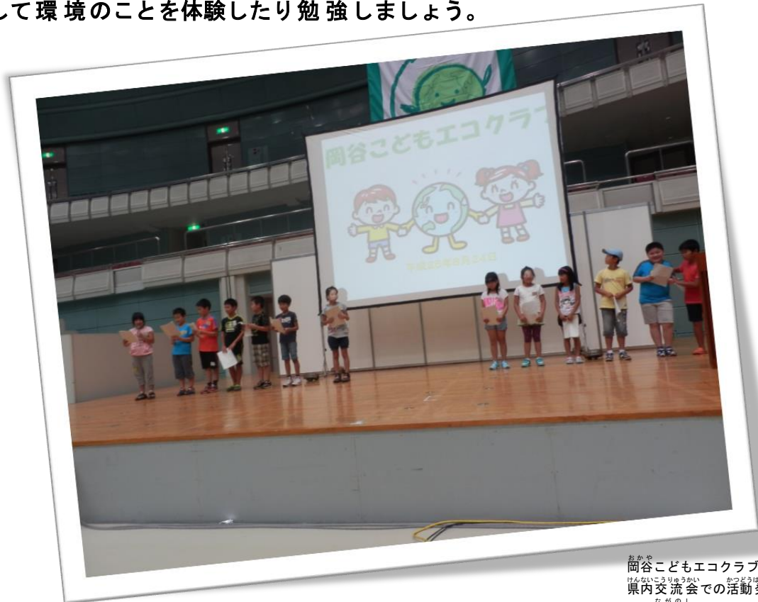
岡谷子どもエコクラブ 県内交流会での活動発表 (長野市ビッグハット)