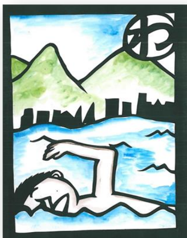
わーきれい 諏訪湖でみんな泳ごうよ