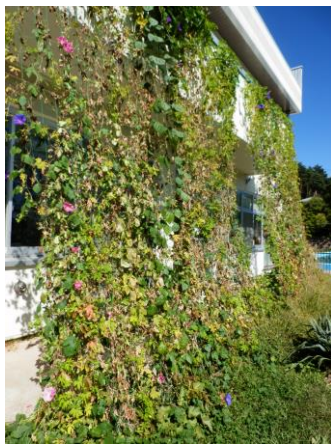
ゴーヤと朝顔のカーテン