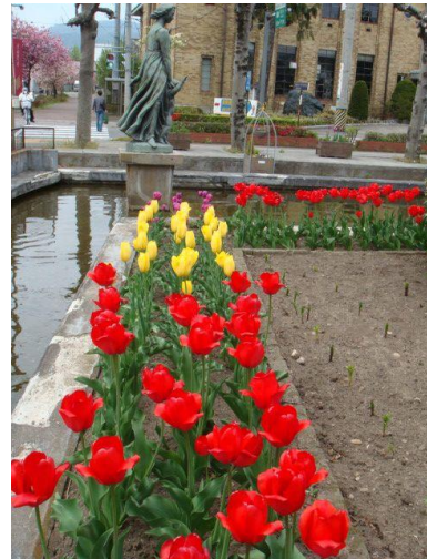
まちの中の美しい緑や昔からのまち