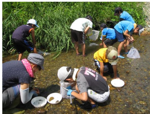
こどもエコクラブ 水生生物観察会