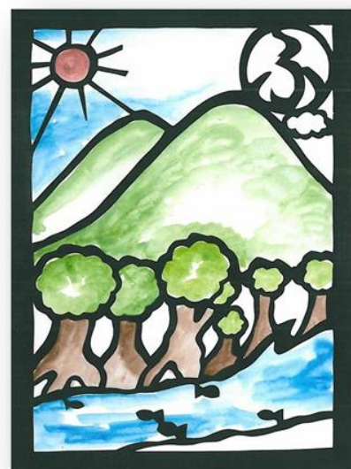
ふるさとの自然はみんなで守ろうよ