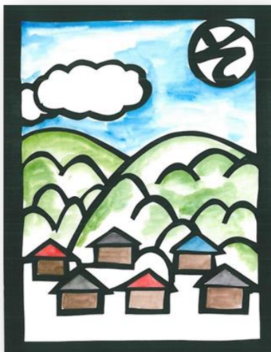
そらたかく青く広がるふるさとの空