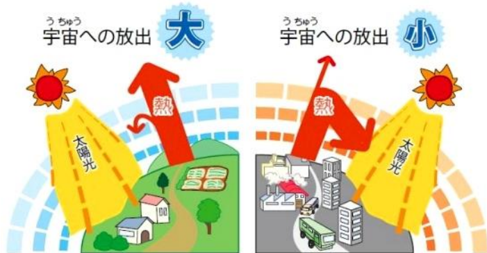
[地球温暖化のしくみ]

約200年前の地球 昔の地球は二酸化炭素が適量だったので、宇宙に余分な熱が放出されていました。