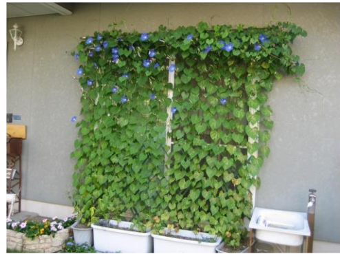
お家でできる朝顔のカーテン