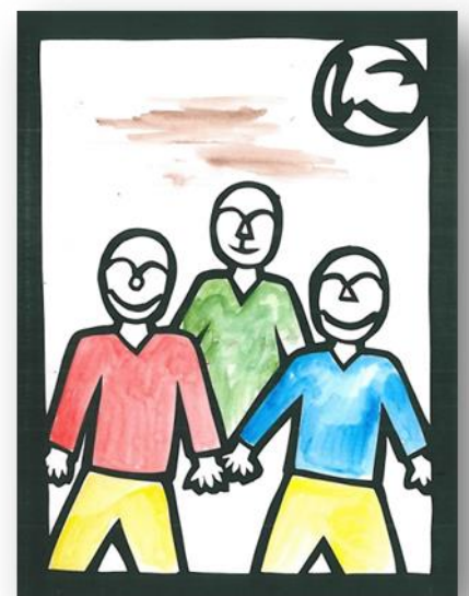
にこにこことみんなが笑える環境へ