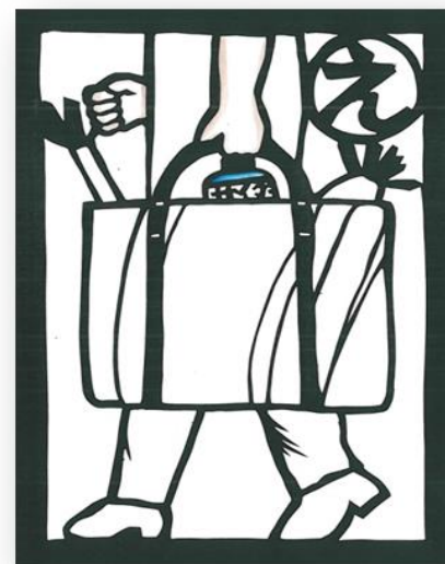
エコバッグいつもわすれずもってこう