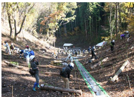
平成18年7月豪雨災害後の治山事業