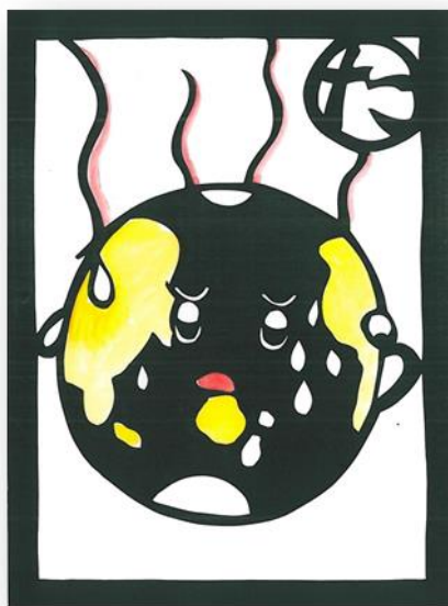
たいへんだ地球がどんどんあつくなる