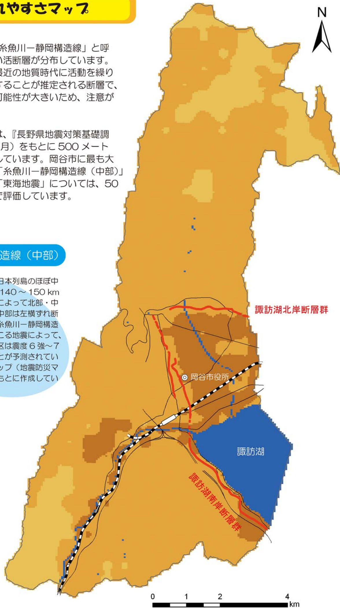
都市圏活断層図 を参考に作成