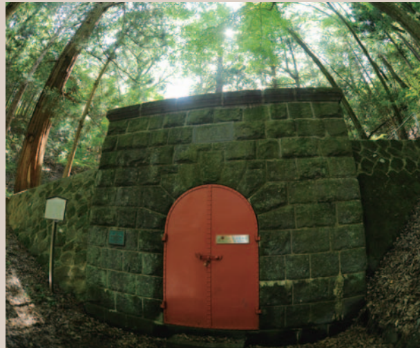
日量最大約1100㎡、かつては製糸工場へも豊かな水を供給した

現在は、山の所有者である岡谷十五社に返還されています。アーチ型の扉のある建物正面は、凱旋門を思わせる切石布積の石造り。約幅4m、高さ3・4m、奥行き19mにおよぶ集水溝内は、コンクリート造りの暗くひんやりとした空間で、深部山側壁面の石積み